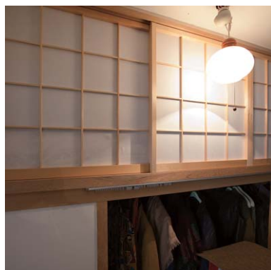
ロフトベッドルーム