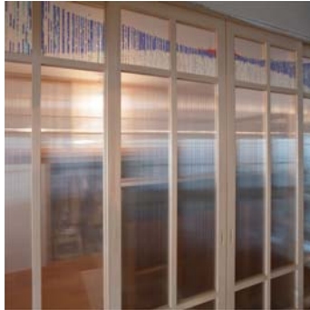
ビーズを埋込んだ建具