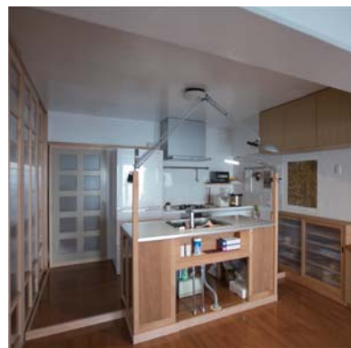
オリジナル対面キッチン