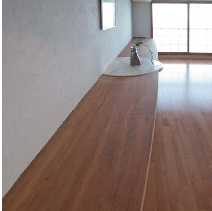
松の無垢板カウンター